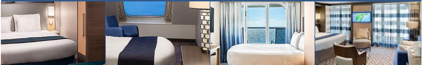
內艙房：約 166 平方呎